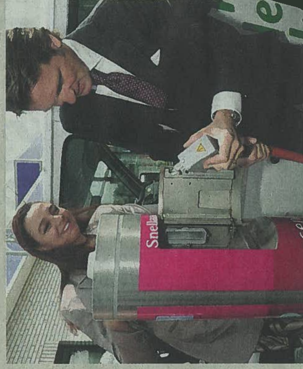
Prins Maurits neemt in Leeuwarden de eerste snellader in gebruik voor elektrische auto's.

AMSTERDAM In Leeuwarden is donderdag Europa's eerste commerciële snellaadstation voor elektrische auto's geopend. Bij een tankstation van Tamoil zette energiebedrijf Essent een paal met een vermogen van 50 kilowatt neer, waarmee een elektrische auto in een half uur kan worden geladen. De paal werd geopend door prins Maurits, aanwezig door het Formule E-team, voerder van het Formule E-team, die de ontwikkeling van elektrische voertuigen stimuleert.